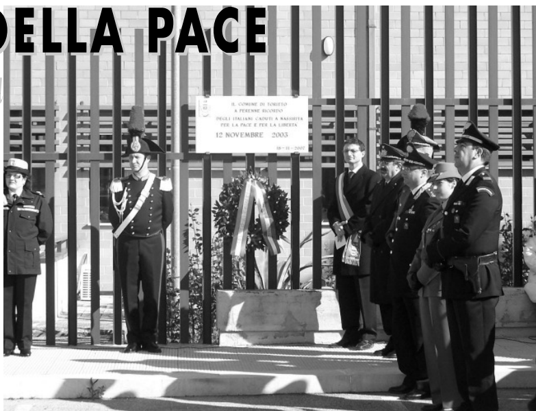
Targa commemorativa dedicata ai Caduti di Nassiriva.

Il 12 novembre 2003, alle ore 10:40 ora locale (8:40 in Italia), un camion cisterna pieno di esplosivo forzò il posto di blocco all'entrata della base militare e proseguì sino alla palazzina di tre piani che ospitava il dipartimento logistico italiano. Dietro al camion irruppe un'autobomba che finì la sua corsa con una forte esplosione che causò il crollo della palazzina e la morte di numerosi militari. In tarda serata il generale Giorgio Cornacchione, comandante del contingente italiano, spiegò che a compiere l'attentato erano stati quattro kamikaze alla guida di due veicoli, che contenevano tra i 150 e i 300 kg di esplosivo, per cui ogni tipo di difesa era risultato vano. Nell'attentato persero la vita 12 carabinieri, 5 militari dell'esercito e due civili che si trovavano sul luogo per girare un documentario sui soldati italiani in missione. Il 27 aprile 2006, mentre un convoglio formato da quattro mezzi militari italiani partiva dalla base di Camp Mitterica per raggiungere una postazione di coordinamento, un ordigno esplosivo scoppiò al passaggio di una pattuglia sprigionando, all'interno del mezzo, forti fiamme che causarono la morte per shock termico di altri quattro