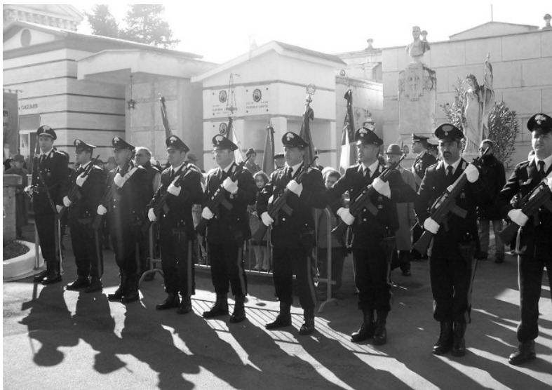
Picchetto d'onore dell'Arma dei Carabinieri.